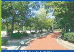
ゴムチップ舗装(自由広場周り) ゴムチップ舗装は歩行感がソフトで疲労や事故を防ぎます。また、透水性に優れ、雨後の水たまりがありません。