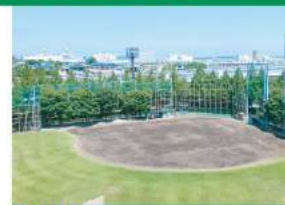
①野球場 軟式野球場(1面)と照明設備を完備しています。 両翼90.3m 中堅100m 内野:黒土 外野:芝生