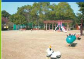
⑥遊具広場 すべり台、ブランコなどの遊具が整備された広場です。ルールを守って、楽しく遊びましょう。