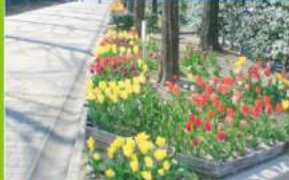
↑公園内では様々なスポーツイベント以外に、緑のカーテンや花植え等のイベントを定期的に行っています。詳しくはお問い合わせください。