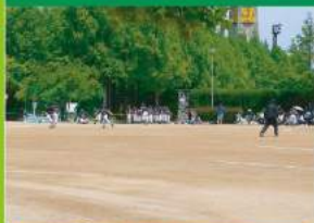
④自由広場 ⑤子どもグラウンド 子どものソフトボールやサッカー、グランドゴルフなどに利用できる土の広場です。