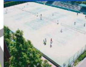
②テニスコート テニスコートは12面(うち4面は照明設備あり)あります。砂入り人工芝(全天候舗装)のため、少雨でも利用できます。